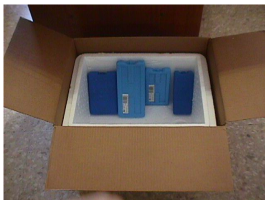
Contenedor extern, Contenedor secundari Acumuladors de fred.

En el cas de tramesa de mostres serològiques destinades al control diagnòstic habitual de malalties sotmeses a campanyes de control, lluita i eradicació (no amb la finalitat de confirmació de malalties o de tramesa de mostres sospitoses de qualsevol procés patològic), els recipients on es subministren els tubs al buit podran utilitzar-se com contenidors secundaris, sempre i quan s'utilitzin contenidors externs que permetin l'arribada de les mostres en refrigeració quan així sigui convenient. La mateixa consideració tindran els racks de microtubs, els quals actuaran com a contenidors secundaris.